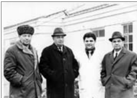
КIэщт Къасболэт (сэмэгумкIэ етIуанэу щыгыр) и лэжьэгъухэм я гъусэу