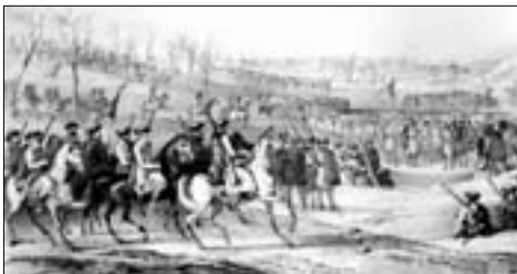
Адыгэхэр я лъахэм папццэ мэзауэ. 1840 гъэ. Сурэтыр Бёлл Джеймс и тхылъым кытхыжащ.