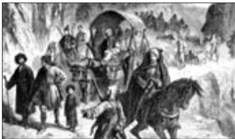
Адыгэхэр хэкум ираху. Сурэтыр 1864 гъэм яцIащ.

Кавказ зауэр шиухам ирихьэлIау дэри мы пычыгъуэхэр щы-теддзэр зэгуэрым ди льэпкъым и щхьэм кърикIуа гуауэшхуэм ири-нэщхьей, пащтыхьымрэ абы и дзэпщхэмрэ зэрахьэу шыта залы-мыгъэр, гуцIэгъуншагъэр зигу темыхуэ куэд урысхэми зэрахэтар ди журналым еджэхэм аргуэру зэ едгъэлыагъужын пащIэщ.