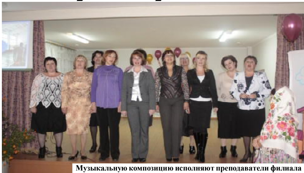
Музыкальную композицию исполняют преподаватели филиала

Череду поздравлений продолжил праздничный концерт. Как всегда на небольшой сцене актового зала было много песен и зажигательных танцев. Порадовали зрителей своим выступлением студия бального танца «Максимум». Много музыкальных композиций прозвучало в исполнении преподавателей этого заведения.