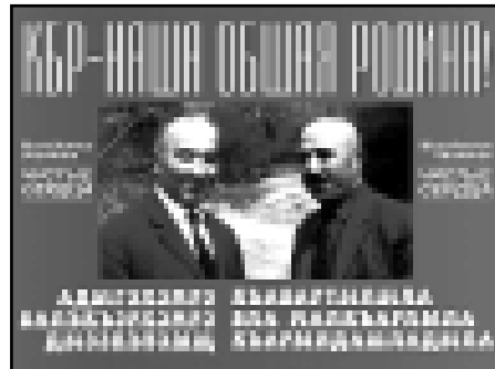
уреат Ленинской премии, народный поэт Кабардино-Балкарии.

Кайсын Кулиев – лауреат Государственной премии, ла-