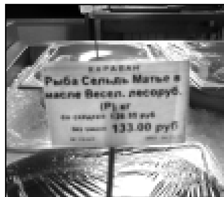
Можно представить себе рыбу «веселый морячок», ну на худой конец, даже «веселый серфер», но сельдь-лесоруб?! Да еще и веселый!?