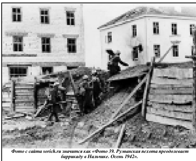
значит как «Фото 39. Румынская пехота преодолевает баррикаду в Нальчике. Осень 1942».