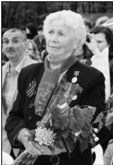
9 МАЯ 2009 ГОДА.

День 9 Мая, несмотря ни на какие снятия монументов и перекраивание истории, все равно остается для всех нас светлым и торжественным праздником, добрым и вечным. С Днем Победы, дорогие наши читатели!