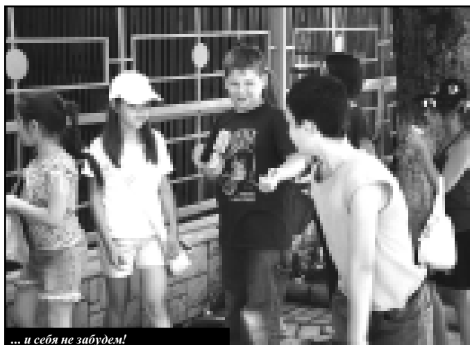
... и себя не забудем!

К нам приезжали артисты со спектаклем из Балкарского театра, дважды из филармонии. И в самой школе дети не скушают: то спортивные соревнования для них устраиваем,