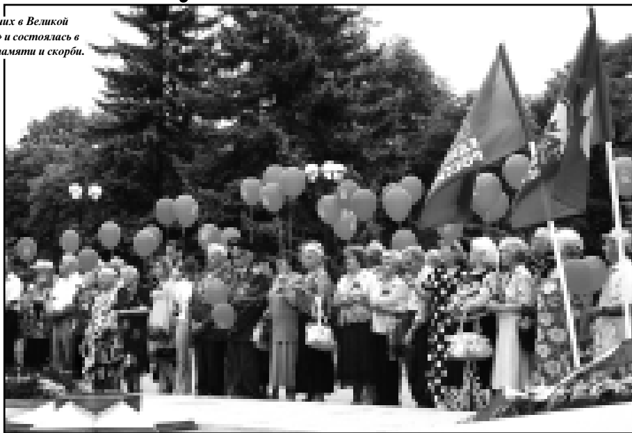
Участники акции запустили в небо 200 красных шаров - как символ пролитой земляками крови, как память о тех, кто ценой своей жизни отстоял Отечество, и возложили цветы и венки к Вечному огню.