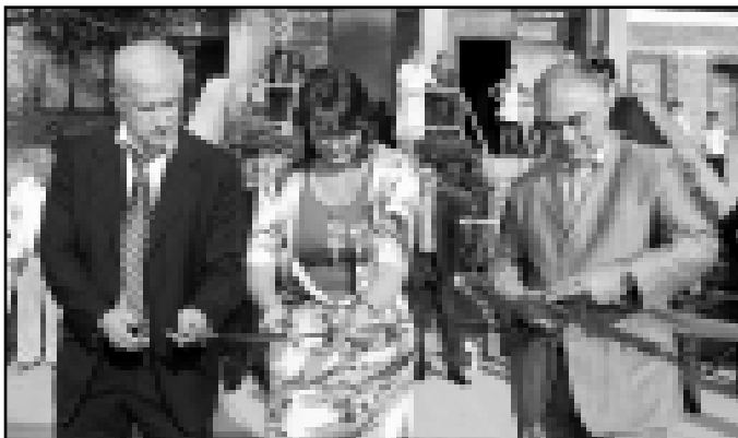
В Кабардино-Балкарии побывал президент Российского футбольного союза Сергей Фурсенко. Глава РФС прибыл в Нальчик из РСО-Алания. До этого Фурсенко побывал в Дагестане. Этот визит он совершил с целью ознакомления с футбольной инфраструктурой на Северном Кавказе и обсуждения перспектив развития Студенческой лиги.