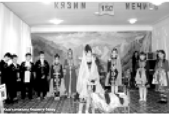
Кызынактын бешкеге бөлү.

лыгын ачыклар эмда ана тилини сабий садда кыалай окутуу халларына эс бурур мурадта бардырылгыанды. Аны бля бир-