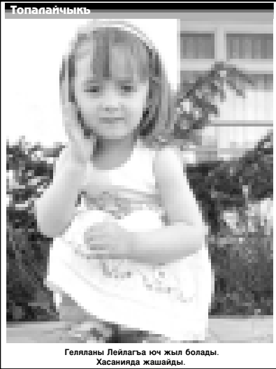
Гелланы Лейлагыа юч жыл болады. Хасанинда жашайды.