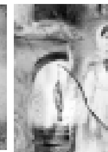
«Жашыкчы чабак бля»