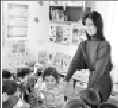
Огары Жемтаданы сабий садында бюгонлюкде 83 сабий конлерин зауукьлу этдөредиле. Булыны юйретгенле, аш-суулары ючюн кьайгыргьанла эки элли да сабийлерине бек сакьдыла. Занкьшилана Арука мында ишленген жыл болады. Алай аруу сөзлю кьыз сабий сахха жюргөн жашкьыкьла да кьызкьыкьла кесин суйдөре билгенди.

Кертисин айтханда, жашууда жери талхан алай тынч тойлоду. Ма мен да телевиденидан кетип, тигуу, сатуу, бизнес бла окуна кьорешип тургьанам. Алай аламы биринден да зауукьлыкь табалмай эди. Жаланда телешоудиде аныла-ялас сенки не болганын. Мен ою эткенден, ичинден зауукьлыкь табарга керекте. Телевиденида ишлеуден а мен май алай кьууанчык сезимле табам.