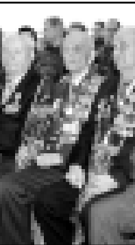
зиде ѳтпѳрлѳген миллиончыны бир минут шумуз туруп эсгердиле.

«Алай хар бирбиз да ишибизге, адамлага кѳе къарамызыны торледимеок, хал табына айнарчыкъ туююлдю», - дегенди ол.