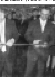
Автозаавода жаңгы машинаны презентациясыны кезиунде кызыл лентаны кесип.

барды. Бюгонюккө «Дервейс» толу кышы бла ишленген автомоту кышы болуу баштаганды. Жылга буюсатта болуп 25 минг машина чыгады. Узона иепери, анда ишленген астап айтанганга