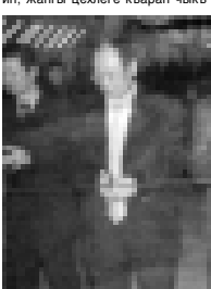
Автозаавода жаңгы машинаны презентациясыны кезиунде кызыл лентаны кесип.

Презентацияга жыйылганына, ак халатпа, чурук кылапа да кийип, жаңгы шекелге кырап чыккы,