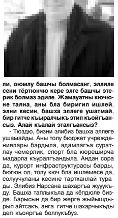
Ахыры 2-чи беттеди.

Къызыл Курган эл Гиче Къарачай районда хар затты да тал къурагъан эди. Сен къытайлуу, билим-