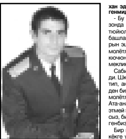
Кырууланууга арт заманда уллуу магына берилгенине шарттыктык этеди...

Космос бизни кантип айткан? Космос бизни кантип айткан? Космос бизни кантип айткан?