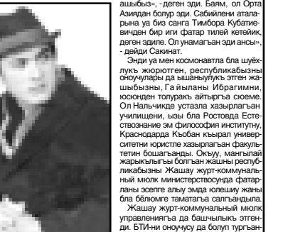
Ибрагим комсомат кысыкларын Боксан-Холан-Бзынгы тау аялауга, Чегем чукурлууга да элтиден. Кеп башы жуу жерлерини бля да шыгыры тийгенди...