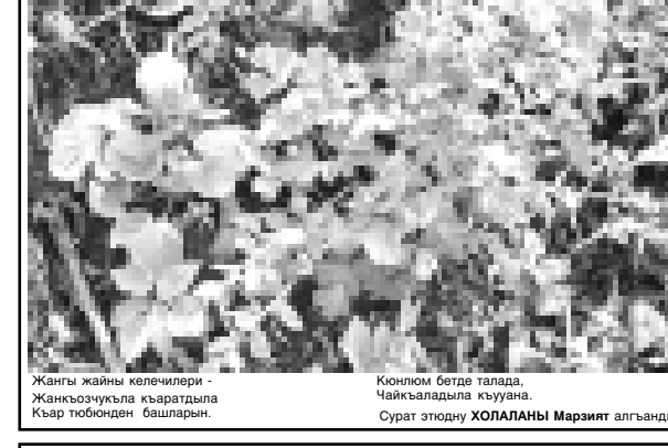
Жангы жайны келечилери - Жанкъозчукъла къардыла Къарт бютобден башларды.