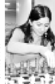
Лигит шахмат ойнап сабийлигинден башлагъанды.

Гроссмейстер къыз къылыгъа алы-жети турниге къагышды. Эки кѐре тишѐруулары араларында дунианы чемпионатларында сѐрпн кѐргенди къаруун. Биринчи кѐре жаланда экинчи кругга, экинчи кѐре уа Нальчикде жарым финалда жетгенди. Болсада Гран-приде хорлап, мурагына жетерге тудкелди.