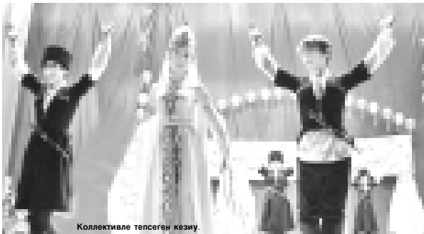
Коллективе тѐпсеген кези.

Нальчик шахары жаш тѐлю союз - Кѐп миллетли жаш тѐлюно бир кѐрп кѐз кыраамлары деген ат бла социальней проектин жашауда бардырады. Аны бла байланыш эки жарыккландыруу семинар, бир да концерт программала кѐрѐзоткендѐле.