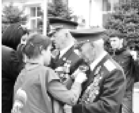
Ламы байрамна къуанып тобере хазырганганраны билдиргендиле. Эсигизде болсун, бойлady акция биринчи кере Хорламын 60-жыллыгына хазырганган заманда башланганды. Андан бери бу эки торюнлю лента Хорлам бла байламлы къуанганды эм ветеранла бла тобешиууени белгиси болуп турарды.

Бу жол акция 26-чы апрельде бир кезиге республиканы торлю-торлю жерлеринде «60-жыллыгын майда» нында, Абхазия майданда эм партияны регион исполкомуну ююню алында - башланганды. Къалайда да адамла бу башламчылыкъа жорек ыразылыкъда тобешигенди.