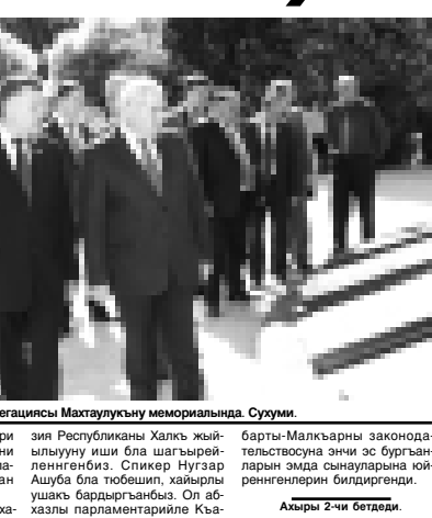
Къабарты-Малкъарны делегациясы Махтауукуну мемориалында. Сукуми.