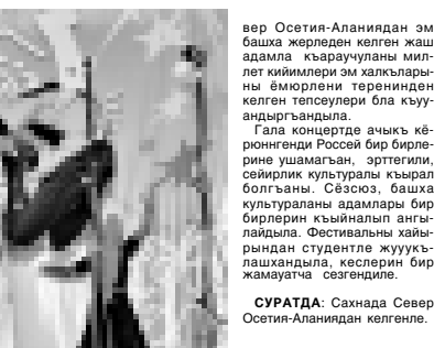
Фестивалны материаллары 2-чи бетде басылгандыла.