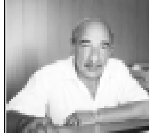
Ахыры. Алы 1-чи беттеден.