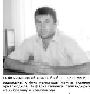
кыягысын эте айланды. Алайда элни администрциясыны, клубну мекямлары, межит, тюкюле орнатылдыла. Асфальт салыныса, тапгандыруу жаны бла уллу иш этилик эди.