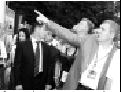
Президент республиканы жетишимберлин иосуринден айтдаы.

Башировичи. Аны айтханына кыре, бек алгы ала экстремистилени ыларындан нех баргъанлырыны сылтауну республиканы башчылары бiл жамаату биргиин ислегере керекдице.