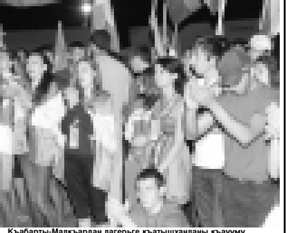
Кыабарты-Малкыардан лагерге кыатышханыла кыаууу.

лоулулугундан, анга кыатышхана бiл тийюшшуден заууктулук алгъанын билдиргенди. Аланы иосурине келгенден сора, бир бирерле бiл байлыкчыларын тас-