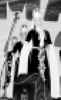
публиканы келечилери Кыабарты-Малкыарда хуерни жаш тейюге муратларына жетере иги амалла кыуралгъанларын аштингенден сора, биргенин проректе жарашдырып, аланы жашаууга мында сингдирдиге сыйгенирени да билдиргендице.