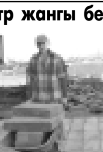
атрла да торленгендерни белгитиди. Алада жагы технологияланы хайырланадыла. Фольеце, сахна,