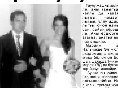
Толу жашны эпилле, аны тангын келле да халаллыгы, чомартлыгы, уллу адамлыгы ючюн намысын, сыйын кёредиле. Аны ёсдюрген атагъа, анагъа испас этедили.