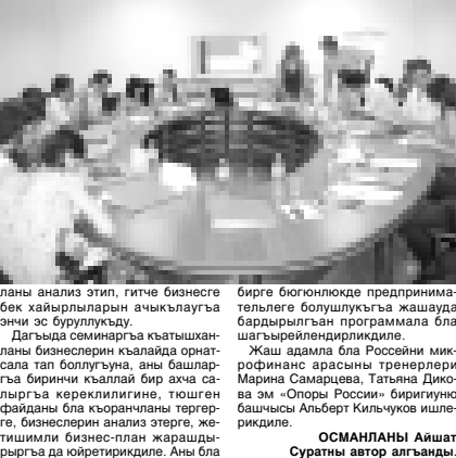
ОСМАНЛАНЫ АЙШАТ. Суратны автор алгьанды.

Семинарны баш магьанасы - предприниматель иш бла энци керюп башлагьан жаш адамланы финансла жаңы бла билимлерин ёсдюрююду, кесини энци бизнесин ачууда керекли теория, практика сынам берууду. Жаш тёлё правительство бардырууну инновация, илму-техника проектелини «Креатив в бизнес» деген республиканы конкурс сайлаудан ётген онеки адам юч кюнчо ичинде гитче предпринимательствода бюгонлюкде болгьан мадар-права эсте бла маркутингьа бла, налогоборюне бла, бухгалтер учёт бла шагьарлейнерикди ле, ахча ресурсуну ёнкючге алыгьа, республиканы бир кьауум кредит учреждениялары берген амал-