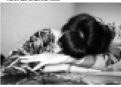
дан этилген чай бек болушды. Валериана къшулган чай да алай. Иги жукълар ючюн, бурун замалдада жылы сютте бал къошул...