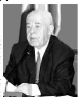
Алары 2-чи бетдеди.