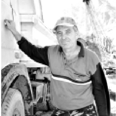
Алары 2-чи бетдеди.

Жолланы итилгени бла аманлыккъы машиналар жюрюткенди ичи киши билмедди. Бегирекада арга къарарга жууалы Бёзонаны Хусейнша шиферга алачы бузулган жерлерине мчымай ремонт этерге тошеди. Ал «чекленген жууапылыккъы болган «Черек жол-ремонт къурулуш управленеи»-обшествода эртден ишлейди. Буорулган жумуш терк да, тынгыла да тамаллаиди, къунда техниканы да тап бардыранды.