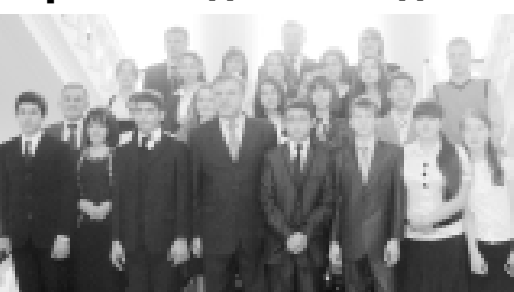
Сыйлы кюн эсде къаларга этилген сурат.

лет: «Мен университетте лекция окуйма. Жарсыуга, жылдан-жылга къарысуудан-къарысуу студентге келедиле бизге. Жаш адамлакъ эринге асары бла да жарамды, арнайы-тайлы окургъа керекиси къ. Жаркъ муларгъа топуса, билиги, жананда кесиг тер болукъ-