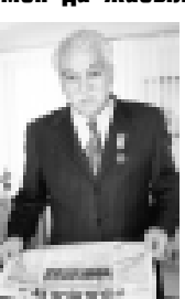
Ана тилибизде чыкъгъан жангыз газетни бетлеринде республикада, ол санда малкъар эпизде, болгъан кѳп жангылыкла басмапандыла. Дагъыда аны алгъан хар адам да кеси сойген материалны табаргъа болукъдуу сѳз ючюн, окуулу ишлери уста билген, алгъа итинген адамланы юсперинден сѳтатъла, зарисовкала, очеркѳле.

Ингирликде юйге келсем, газетѳе къарамай къоймайла. Сейрсиндирген материалла бѳтѳн а медицинада жангылыклагъа эс