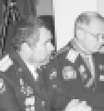
Жыйылыуга кыатышхаланы къаууму.