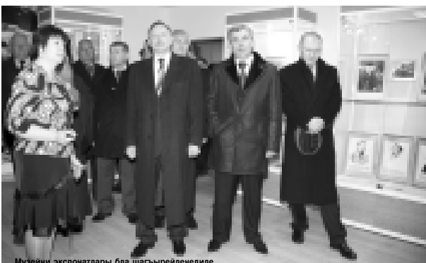
Музейни экспонатлары бля шагырейленедила.

Музейден ала «2009-2015 жылда Къабарты-Малкъарда физкультура бля спортну айнаыуу деген республикалы программа чеклерине бир жылы ичинде ишленген «Майскый» физкультура-саулык кичуле комплекси ачылууна тейрегенде. Аны курулушуна республиканы бюджетинден 69 миллион 858 миң сом кыратылганды. Алайда уа делегацияны жаш спортчула, школчула да сакълай азыла.