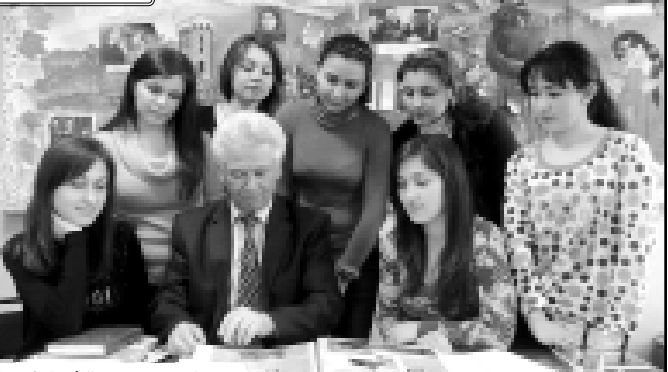
Хьа Сэфарбий студентхэм яшгылуу. Суртэр КВАРЕЙ Элинэ тхьар.