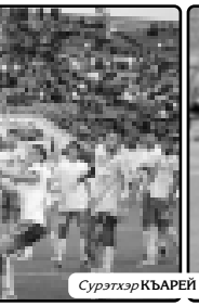
Сурэтхэр КЪБАРЕЙ Эллин трихакь.