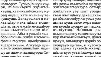
Дунейсо Адыгэ Хэсэн и ээлушэм хэтэ, 2010 гээ