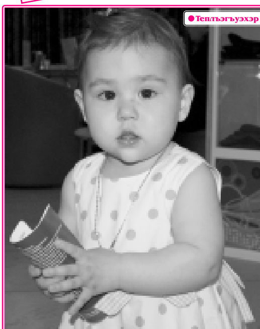
Николь Соци кызлом шонету. Пашао гэфиним и дэ-апор лэпкэ зырлэ кыжэжым...