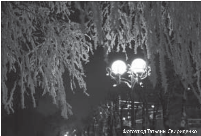
Фотоэюды Татьяны Свириденко