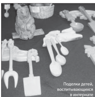
Поделки детей, воспитывающихся в интернате

Организаторы особо отметили весомый вклад председателя Комитета Парламента