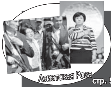
Азиатская Роза стр. 5