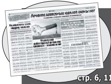
стр. 6, 11