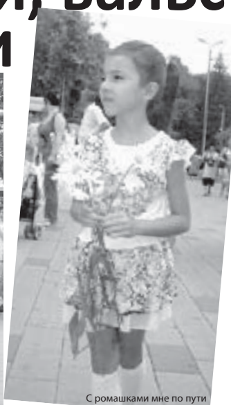
С ромашками мне по пути

праздником и отметила, что чистые семейные отношения – залог рождения физически здоровых и красивых детей. Она сказала,