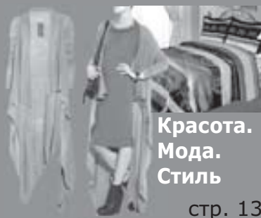
Красота. Мода. Стиль