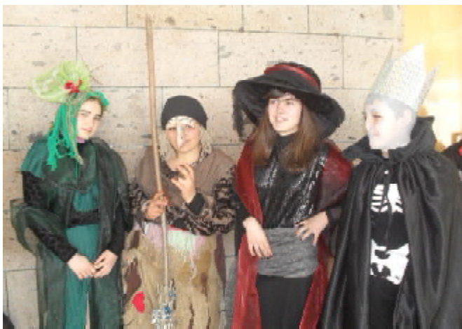
Учащиеся театральной студии «Непоседы»