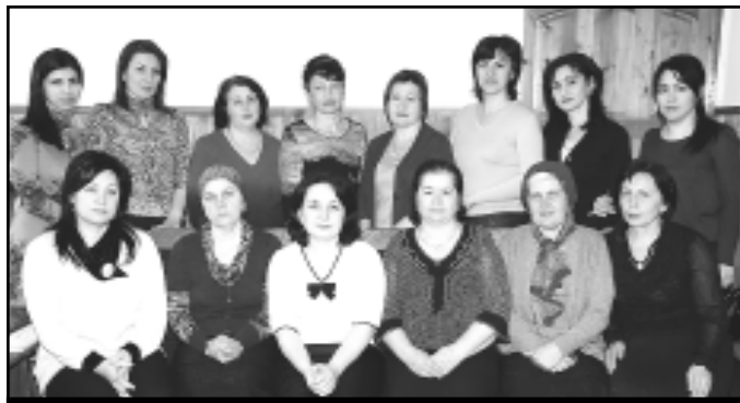
Коллектив учителей кабардинского языка, обладатель Гран-при в фестивале-конкурсе «Мой язык – моя душа, мой мир»

например, или по физике. А чем же родные языки хуже? Надо не легких путей искать, а прикладывать максимум усилий, чтобы исправить оценки, лучше узнать родные языки. Тем более что со стороны учителей все для этого делается. Что конкретно? Во-первых, стараемся заинтересовать детей. Мы не преподаем «голые» грамматику и литературу, наши уроки это всегда симбиоз нескольких предметов – истории родного края, географии, биологии даже, это и изучение местных традиций, обычаев, обрядов, эпоса. На уроках мы читаем и разбираем и народные сказки, и современную литературу, разыгрываем сценки, диалоги, проводим простые сравнительные анализы языков – русского, кабардинского и балкарского. Во-вторых, мы всячески поощряем успехи наших учеников в изучении родных языков, особенно это касается русскоязычных детей. По-