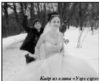
Кадр из клипа «Уэрс ээрс»

- 14 лет я занималась балльными танцами. Шесть из них – спортивно-балльными в «Гелиосе», потом солировала в театре танца КБГУ «Каллист». И вот уже месяц как с танцами пришлось распрощаться. Я заканчиваю бакалавриат, пишу дипломную работу. К тому же я поняла, что наступил предел, мне не к чему стремиться в танце. Жаль, конечно, ведь я просто жила танцами, но изменились приоритеты, надо двигаться дальше. Окончательно разойтись со сценой у меня не вышло: уже год я являюсь ведущей почти всех мероприятий, проводимых университетом. Однажды попробовала – и поняла, что мне это очень нравится. Никакого мандража, трясущихся коленок и срывающегося голоса... Вполне комфортно. Думаю, этим и продолжу заниматься. К тому же, филологическое образование, думаю, в этом деле большое подспорье. Ведь для ведущей мало иметь эффектную внешность, немаловажна и культура речи.