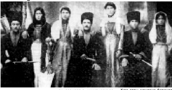
Кючменланы юйор 1912ж.

ни келлерине ушамаганды. Бир жолда апа, жыйылып, бу эки адамны кероп болмагандарын бир бирлерине ачык айткандыла, аланы элден думп этерге келешкенде.