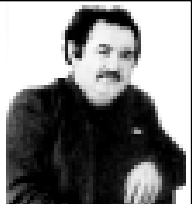
Хусейн шокон жылларында окуяна