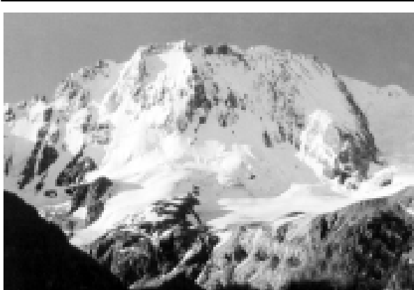
Улуу тау.

Аптекага кире да турмай Чачыруук сизин безиткен эсе, сизге андан 2 сагытын ичинде куултугуура былай рецет болуучурукду: ит тогонден бир устукуну (ийримилтегенни) алыгызы, жибитип, аурга салынгана иги ышыгызы да, чачыруукуу юсонде салгызы эм байлагызы. Бир-эки сагыат озгандан сора чачыруукуу бузулукту эм ичине кетериди. Сизин жорегигиз, тишигиз нады аш орунугуз ауруй эселени, кичи мурутканы сундыргызы да, аны тышканы ичинде пёнкасыны сакь кобонур алыгызы, аны ич жабын айландырып, онг кыюулууну чыкайны бармаккыга чыгаргызы. Ауруй 20 минуттан сора шошайыргызы. Сиз сумияз турганлай бир жеригизге жара тоюрсол ачытдыгызы эсе, алыгыгызы та залендула сууда жибитилген газа