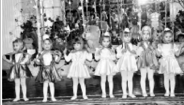
Сабийлени кюноне аталган материалла 3-чо бетде окугусыз.

Бюгон - Сабийлени къоруулауу жалкыла аралы кюнодю