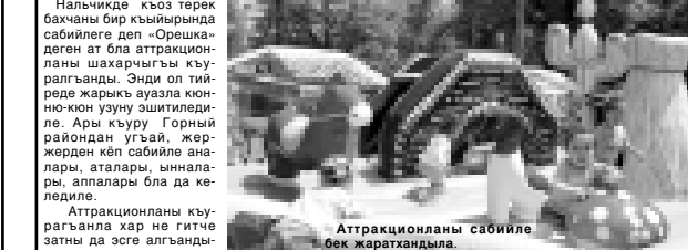
Атракционланы сабийле бек жаратхандыла.

Нальчикде къоз терек бача - бир къыйрында сабийле деп «Орешка» деген ат бла атракционланы шахарчыгы къурапганды. Энди ол тийреде жарыкъ ауазла кюн-кюн юнуу зшитилдиле. Ары къуру Горный райондан угтай, жер-жерден кеп сабийле аналары, аталары, ынналары, апалары бла да келедиле. Атракционланы къурагынла хар не гитче затны да эсге алганды. «Орешканы» ичинде да зауукълуду. Къызчыкъла бла жашчыкъла ойнай, уа, тургуну, абаданла теркелени салкъунла олтуруп солурга, чай, кофе, татлы, гара суула ичергеле, морожене ашаргы болуучудула. Сууукъ, жауну юкнде уа гитчеле, улупла да кафеге кирип, анда жумушак иллула