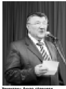
Чеченланы Анур селешеди.

Сабийлени къоруулануу халкыла аралы юноне аталып, РФ-ни Сабий фондуну КъМР-де белиюмо, республиканы Президентни Арсен Каноковну «Огурлулукну жай» деген теле-марафонун бардырганды. Ол тоне не Жашин театра болганды.