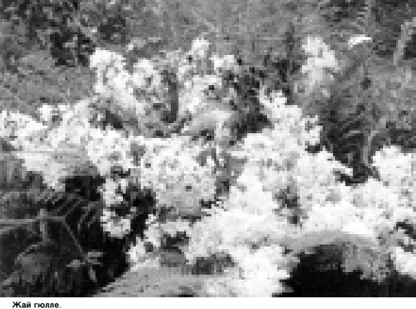
Жай голле. Сурат этюдну ОСМАИЛАНЫ Хысыс алганды.

Бир къауум мероприяте да бардыргынбыз. Аланы санында артыкъда 2-чи номерли лицейни базасында къуралгын Улуу Хорламга аталгын семинарны белгилегез сюеме. Поэти уруш жыллада жазгын назмуларны юсери бла хакъ телюню юйертиш уа да бардырылуккъымды. Къайсыны назмуларын окуп, школчула араларында эршиуде да болууды. Жарсыука, бир къауум замандан бери Чегем районда террористлеге къажак операция (КТО) бардырылганы себепли экскурсияланы санлары азайганды. Бери келликлени алларында милиция машинала болмай, ала ашармай, музейге барыргы жарамлы турады.