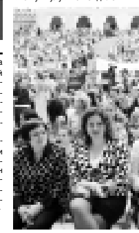
Ахыры 2-чи бетдади.