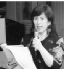
эди деп оюмлайма. Ол умутубуз топса, культура арада художникле кермочле къурача зап ачылып, торло-торло тобешуле бардырыргы онг табарыкъ эдик.

Харкюнлюк ишбини уа бардыргандай турабыз. Къулиланы Къайсыны чыгармачылыгын жыйышдыры тохтамайды. Аны прозасын цифрага (диклеге) къчырора да барды. Дагыда Интернетте Къулилу улуу музейни сайты барды. Поэти чыгармаларын пропаганда этиуде ол уллу себепди. Хар жаңгы информацияны анда табаргы болуучуду. - МПР телеканал музейни юсондон фильм салгын эди. Аны телевидениядан бир неча кере кърготтендиле да, кепле оюмларын билдиргендиле. Къайсыны келир жыл юбилей болуучуду. Ол байрамны бир кесиги поэти юйюнде музейиуде ётноучуду. Жер-жерден келик къонакъларга тюбергез харзакламысыз? - Озгын юбилейини алында музейге юмен этилген эди. Ол биз сюйгенна тынгыла болмагын эсе да, уймагынбыз келген къонакълардан. Косметика ремонт артыкъ болуук тююл эди дагында. Жылыу баргын система жаңгырылганды. Музейни жаңында болгача тереклеге къаралып, пахта да салынгандыла. Бу ишлени жый сайын этпей турабыз. Шенду уа суу баргын системалык, юйю фундаменте, поэти эсертмесине да ремонт керекти. - Музейни жаңында культура ара ачар мурагыткъы да бар эди... - Ол, жарсыука, мурагый къалады. Бу проект биз элзегенча къуралса, бек хайрылы болуук