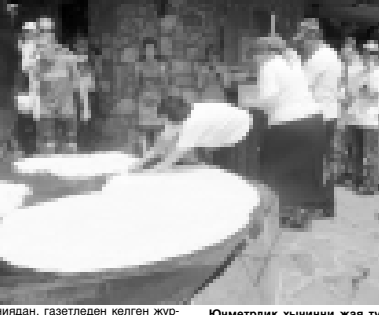
Юметрилик хычинни жур раддыла.

ген жалбауруладан а, жангыз бир керек окъуна къапсан эди деп, кеплени аууз суулары келе эдиле. «Ы, маржа, бозгъадыдан бир уртлам окъуна къалмагъанмыды» - деп, ол суусалны алай излей эдиле. Дугуму бла намыкны, жалкыдыны жангы бутакларындан къайнатылган чайларын а ол тауусулгъандан сора да кепле излей келе эдиле. Прикубанский районну Кавказский этлиде кеп торло миллетле жашадыла. Орусула, украинлыла, дагъыстанлыла эм башхала. Мында кьарачайлыла да кепюле. Ол элден а, кеси биширген ашарыкларын алып,