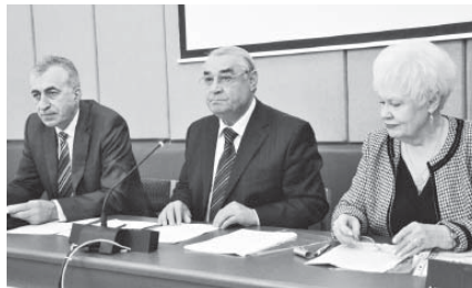
Акъры 2-чи бетгеиди.

История имуляны доктору, профессор, КЪМКУ-ну Социально-