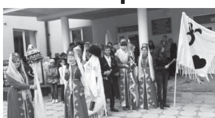
Огъары Малкъарны 1-чи номерли школуну къуаууну байракълары бла.

Кѣп адам келген эди ол кюн ары. Кѳрегерлерине къуанып, уллу заууклуук да алып кеткен эдиле. Аны кургарган Тѳтуланы Хадис бу огурлу ишни тѳреге айлардыркъа деген