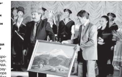
Кыонаккыла Минги тауну суратын бергенди.

«Нальчик - СКФО-ну культура орасы» деген фестивалыны чыгарып бизни ара шахарыбызга белги теспеу коллективле, жырчылар кыялралы союгемге байрамга бурулганды.