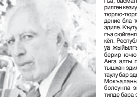
Суратта: Моксаланы Магомет АлимКешоков бля.