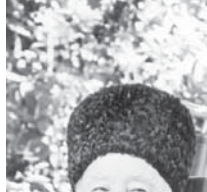
Белый келпесем, жетпесем Малкырага.

манчылык драмусуна аны буюн бийикте көргөнү, берекети, даражасы да этген.