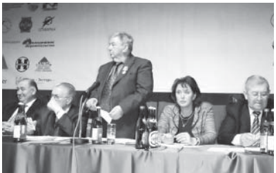
Съезд баргъан кезиуе.

«Иш би мауратлары - регион илиму-техника жаны бла жетишмилери ачыккладуу эмда производствоза синдириуду, илиму эмда инвестициялы компанияларыны союзуну (СНП) 6-чы съезди зис» деген ярмарка-биржа да кыурагъандыла. Илму-техника сфераны гиче предпритияларын айнугъутуула саулукты этиу форуму Къабарты-Малкъарда бөлмюе да презентация этген эди. Аны бла бир нанотехнологияланы эм композит материалланы юсонден «Композит» деген конференцияла да болуштурулгандыла. Битеуроссей конференция болганды. Форуму чеклериде Къабарты-Малкъарны Промышленликтерини бла предпринимательлерини союзуну (СНП) 6-чы съезди