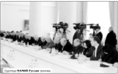
Суртыр МАМИЙ Руслан трихаш.