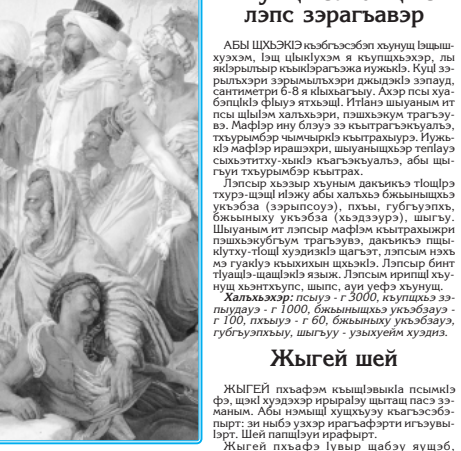
Бонопарт Наполеон адигэ мамлюксэм и тхьамдэм хуаду, Мысар, Каир калад, 1798 гээ