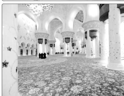
Шейх Зед бин Султaн бин Нaхъян и шaкIэ шьлэ мэжджыт дуней псом шaхуа мусльмaн тхьэдъэлъулIэ нэжэ иныгъэ зыхьэдэ. Абы Мэжджыт хужьышхуэуэи нэждэ.

ЗИ ХЪУРЕЙГ'ЫКIЭ пшакъуэушым узшырхьалэ мь ухуэныгъэр тельдыджэ. А мэжджыт шадар ди зынырщэр - 1998 гъэм Абу-Дабь кышаргагъажакъ икIи 2007 гъэм и нэцI мазэм кызылуахъц. Абы фланач Хэрып Эмират Зэгугъэр кызызыгъэпэча икIи и ягэ президенту шьта шейх Зед бин Султaн алы Нaхъян и шьр. Мэжджыт шьху мун 40 зыуэ шьтэ. Абы колонна 1096-ра илэ, аиастра аргатукъар фьалыц. Кыбалу тыхыныгъэу, алуэгу идадэ метр зэгъуэзатIэ мун 7 зи инагъ алырбыгуэ - ар Гиенэ и рекордхэр аратъ тыхыныгъэу. Абы и гъахъэрыныгъэм зэгъуэзатIэ 1200-рэ, техник гур 20. Топи далагъуэу шьхуэ 30 сэлъанк. Алырбыгъуэм тонн 47-рэ и хьэлъэгъуэ - тонн 35-р цыц, тонн 12-р бжъахуэц. Абы зэгъуэзатIэ мелуны 2-рэ мин 268-м цыгуэ илэц.