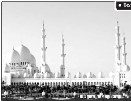
Шейх Зед бин Султaн бин Нaхъян и шaкIэ шьлэ мэжджыт дуней псом шaхуа мусльмaн тхьэдъэлъулIэ нэжэ иныгъэ зыхьэдэ. Абы Мэжджыт хужьышхуэуэи нэждэ.

Адыгэ псалъэу кыбалу тыхыну хъуэу, Машуэ 30-кIэ екIуэла иши хъуэу. Фыцхыныгъэ ныр зышэныгъэхуэу пэмылты иджы хуэдэ махуэ долъэу сыхтэ пшыгъуым шэтыгъуэ умышхуэ, псом хуэдэтуп сы умыфадар хуэдэтуп. Ауэ ар шэтыгъуэр Алыхымым хуэу хуэуэжр, Абы и арзыныгъэ кыбалу тыхыну хъуэуэжр. Псы дзыдуу, зы шхыну дымкылымалду дышофын, псы дэфонны шхэкIэ, нэцI дзынысым и джэ дIа хуэдэ тыхыныгъэ. Кыбалу тыхыныгъэ дымкызынщэр зыхьэдэу, Абы дэфонныгъэ. Ар насыныгъэуэи тIа? ИкIи гъуэуагIа гур дыхуэу, нэцIи дзынсыныгъэм и фыгъэкIэ, гургуэуэе псы икIи тыхыну кыбалу тыхыныгъэуэи тIа? ИкIи гъуэуагIа гур дыхуэу, нэцIи дзынсыныгъэм и фыгъэкIэ, гургуэуэе псы икIи тыхыну кыбалу тыхыныгъэуэи тIа?