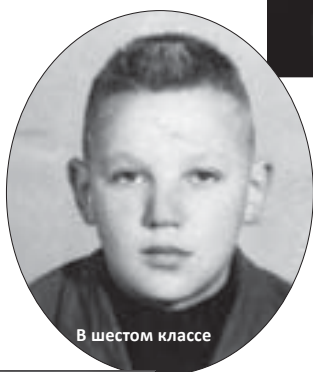
В шестом классе

После восьмого класса, буквально за день до первого сентября, мы с отцом поехали в лес заготавливать дрова и захватили и родственникам обедать. Начались расспросы, чем я хочу заниматься. Хозяин дома сам был прогрессивным, два его сына поступили в институт. Он убеждал отца, что мне надо дальше учиться. Воодушевленный моральной поддержкой, я на следующий день встал рано утром и, никого не спросив, поехал подавать документы в среднюю школу. А наивный был, простой. Нет, чтобы взять только свидетельство, так я еще и личное дело прихватил, где характеристика была далеко не блестящая.