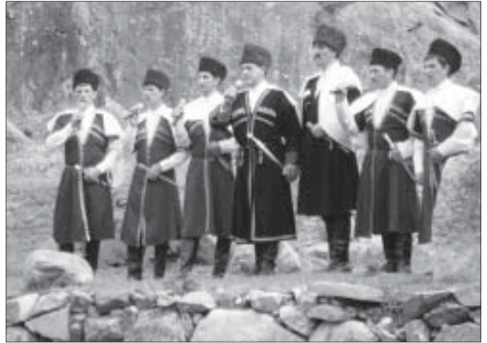
▲ Хор из Ташлы-Талы