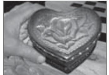
▲ Шкатулка изготовлена заключенным ФКУ ИК-3