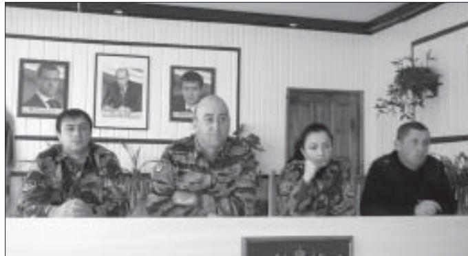
▲ Заседание комиссии в ФКУ ИК-3

академии. По договору осужденные будут платить пятьдесят процентов стоимости обучения.