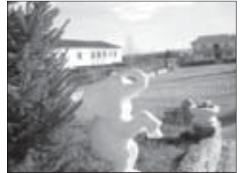
▲ и слоники - работа заключенных ФКУ ИК-1