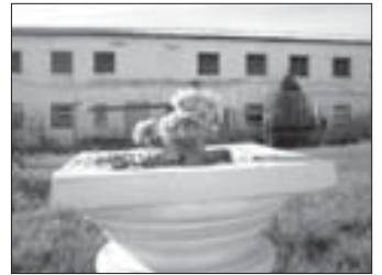
▲ Вазон для цветов

Мастер обучает своему делу молодых. В сувенирном цехе мне подарили шкатулку