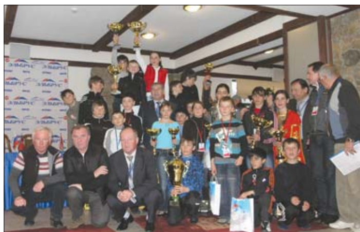
Победители Кубка. Фото на память