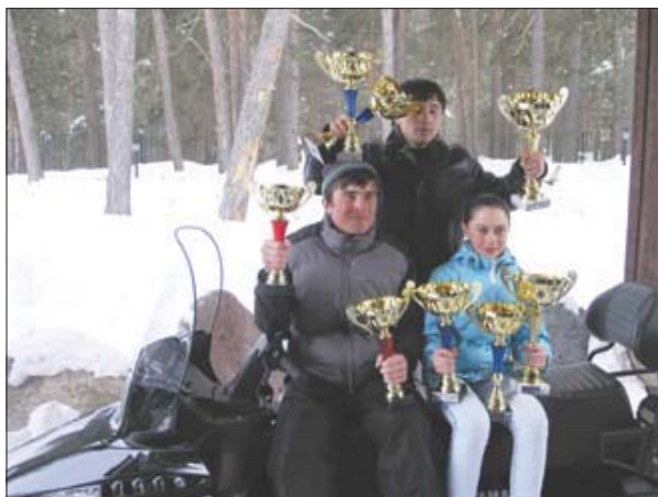
Большинство наград, в том числе и главная, остались в Терсколе