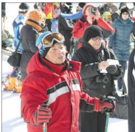
Большезики переживали больше самих участников