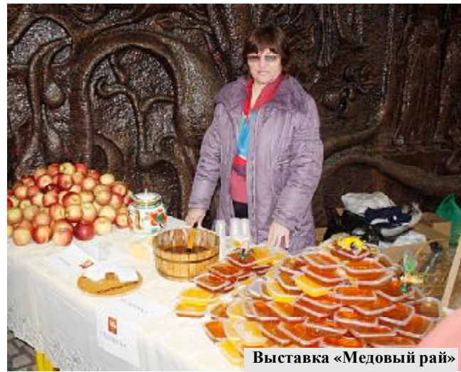
Выставка «Медовый рай»